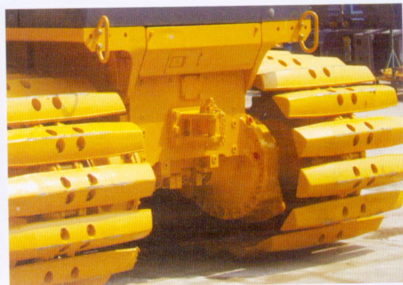
三齿松土器 3-SHANK RIPPER